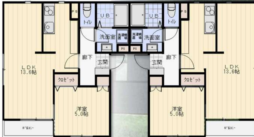
1号タイプ 42.42 m 2 2号タイプ