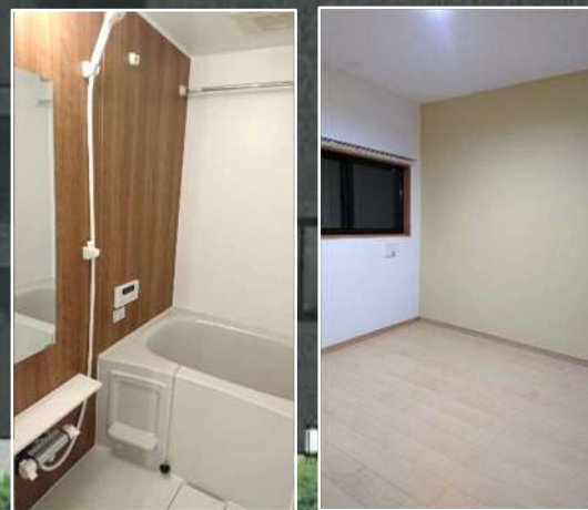
※写真は同シリーズタイプの写真になります。