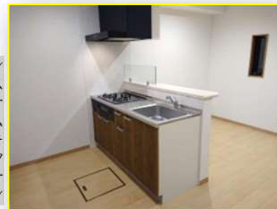
システムキッチン